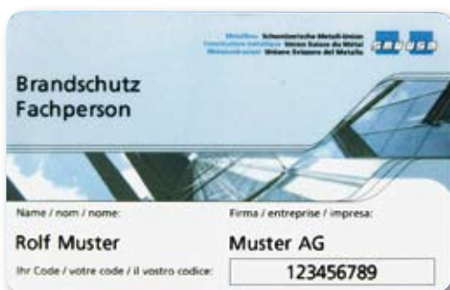
Der persönliche Ausweis für Brandschutzpersonen

Heute stehen in der Metallbaubranche über 700 lizenzierte Firmen und über 1000 Brandschutzfachpersonen zur Verfügung. Diese kennen die erhöhten Anforderungen an Brandschutz, die VKF-Brandschutznorm und das Reglement der Verbände VST und SMU. Sie zeichnen sich durch das Label «Brandschutz geschult» aus. Dieses Kennzeichen hilft vor allem Auftraggebern bei der Auswahl eines qualifizierten Partners. Die Schweizerische Metall-Union überwacht die Anwendung des Labels. Zuwiderhandlungen werden durch die SMU zivilrechtlich belangt. Ein Auftraggeber kann sich also auf das Label verlassen.