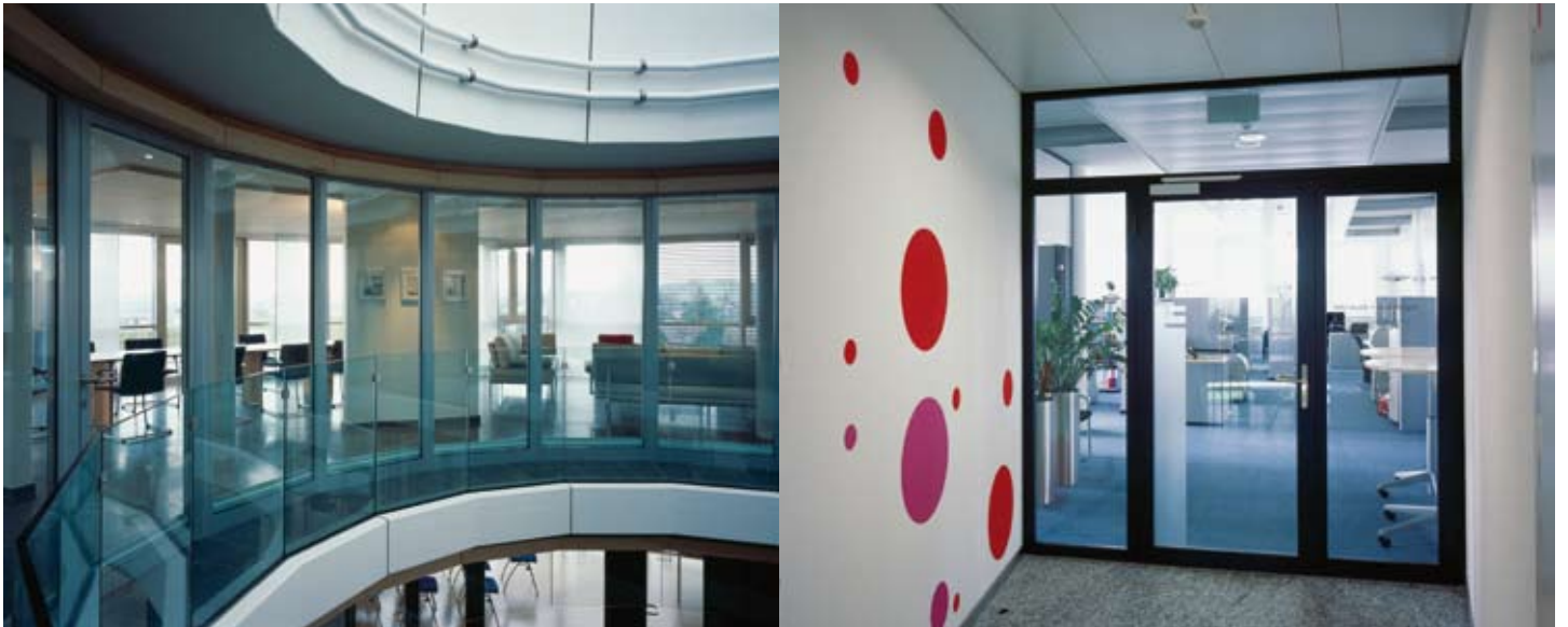
Brandschutztüren: Bilder der Firma Forster Rohr- & Profiltechnik AG, Arbon